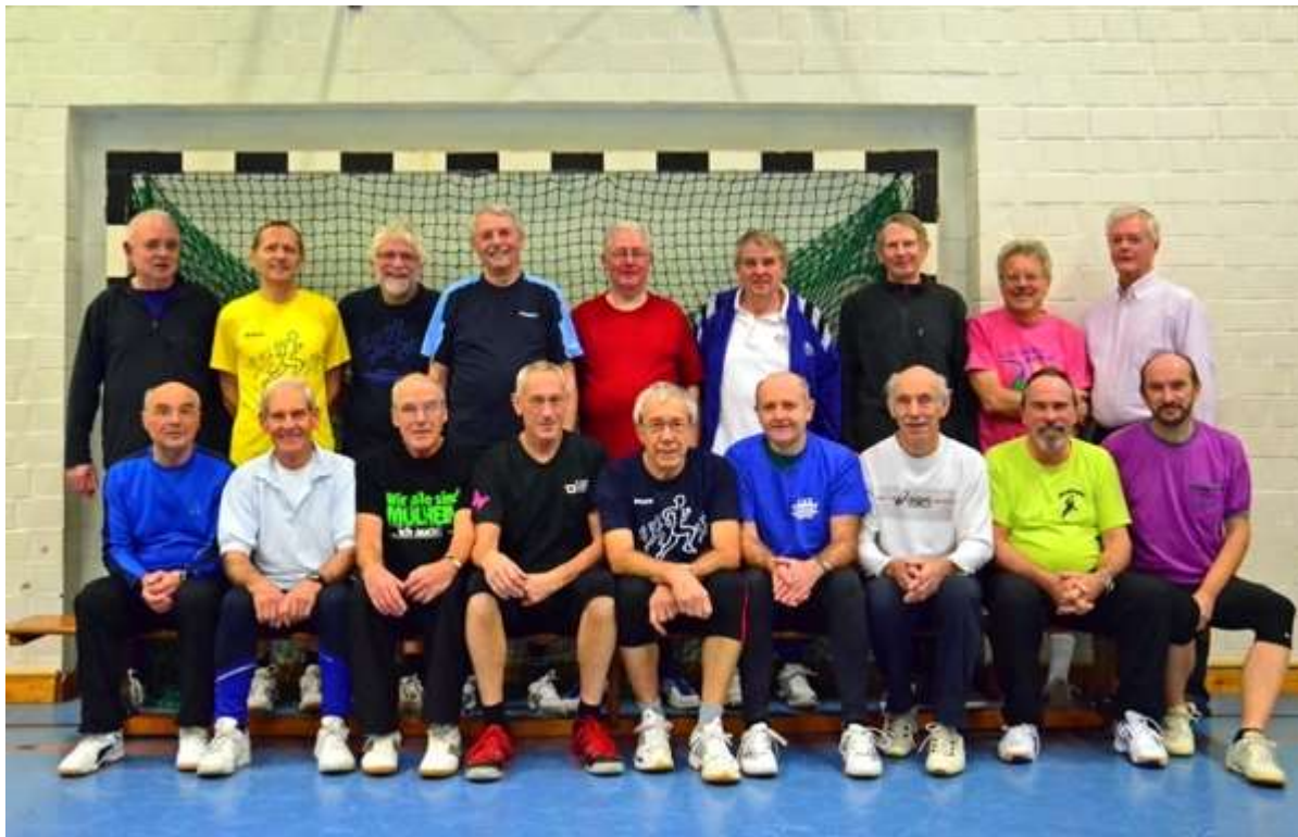
Oldtimer Gruppe: Einige Jahre später