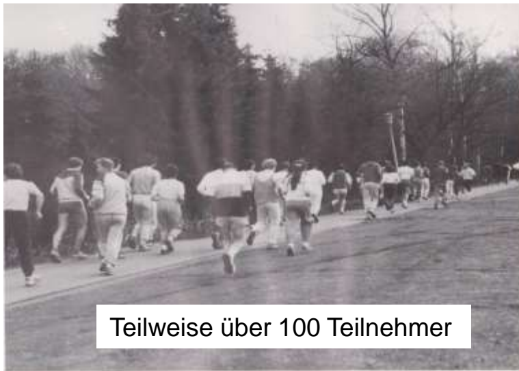
Teilweise über 100 Teilnehmer