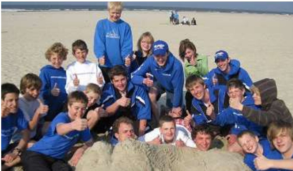
Trainingslager auf Norderney

Die Power-Kids und die jugendlichen Athleten haben Dank der engagierten ÜL „starken Aufwind“ bekommen. Sehr gute Ergebnisse auf Stadt- und Kreisebene. Trainingslager in der DJK-Sportschule in Münster und auf Norderney